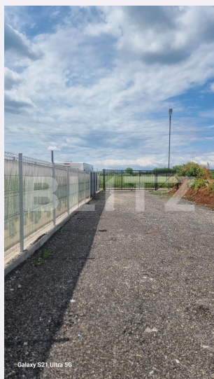
Galaxy S21 Ultra 96