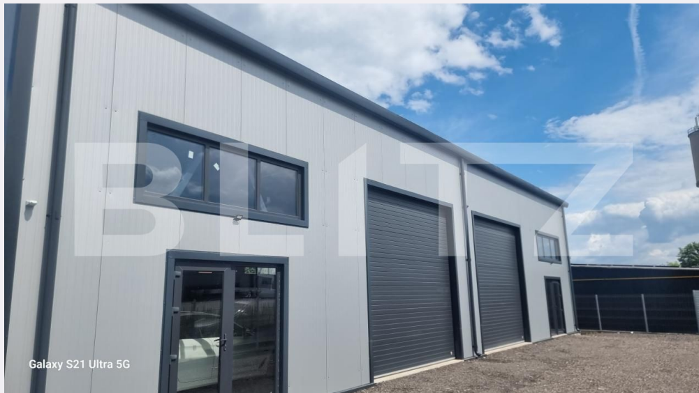
Galaxy S21 Ultra 5G