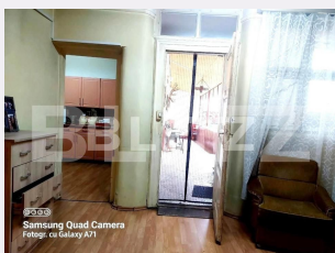
Samsung Quad Camera Fotogr. cu Galaxy A71