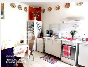
Samsung Quad Camera Fotogr. cu Galaxy A71