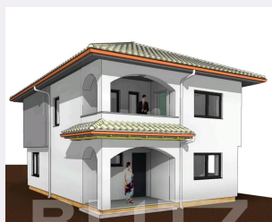
2 Vederea A