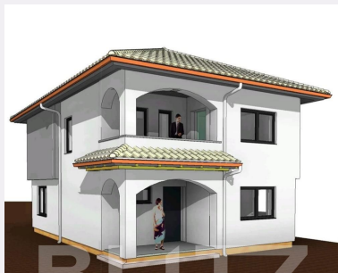
2 Vederea A