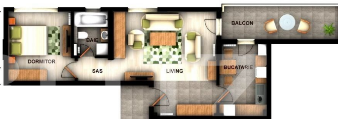
PLAN INCADRARE PE NIVEL / ORIENTARE