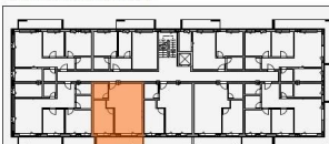
APARTAMENT 1 CAMERĂ - tip 10

S.utilă = 43,78 mp S.desfășurată = 55,45 mp S.desfășurată balcon = 13,93 mp