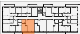
APARTAMENT 1 CAMERĂ - tip 10

S.utilă = 43,78 mp S.desfășurată = 55,45 mp S.desfășurată balcon = 13,93 mp