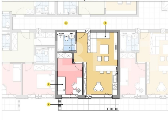
PLAN ETAJ CURENT (ETAJ 1, ETAJ 2)