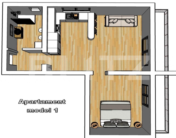
Apartament model 1